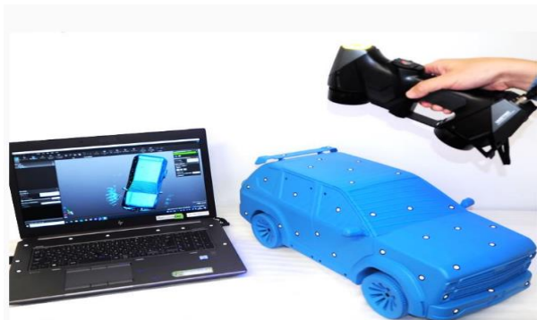
風洞実験ソリューションサービスのモックアップ (模型イメージ)