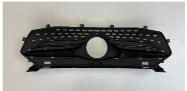
「サブスク 3D プリント」の樹脂造形物サンプル