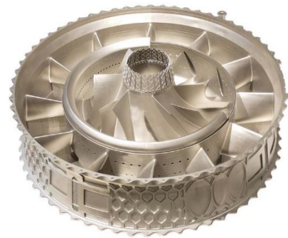
BLT 社製金属造形物サンプル