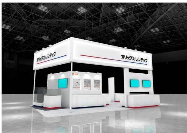
展示会ブースイメージ

オリックス・レンテック株式会社（本社：東京都品川区、社長：細川 展久）は、2024年1月31日（水）～2月2日（金）の期間、東京ビックサイトで開催される「TCT Japan 2024 -3Dプリンティング & AM技術の総合展-」 ※1 に出展しますのでお知らせします。