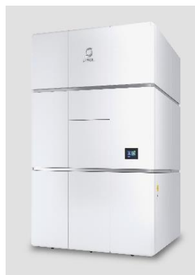
クライオ電子顕微鏡

クライオ電子顕微鏡は、タンパク質などを瞬間的に凍結させることで構造を保ったまま観察できる装置です。研究第一を理念に掲げる東北大学は、2024年に運用開始を目指す次世代放射光施設 ※2 との相補利用により、ナノからマイクロまでのあらゆる物質を可視化できる環境を整えます。主な観察対象とするタンパク質だけではなく、有機材料、有機・無機ハイブリッド材料 ※3 など幅広い分野での研究が可能になることから、ライフサイエンス分野での疾患発症のメカニズム解明や創薬研究などの他、グリーンイノベーション分野での省エネルギーにつながる新素材の開発などへの活用が期待されます。また、当該システムを他大学および企業と共用することで、幅広い分野での革新的な研究開発に貢献します。