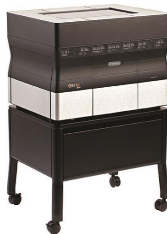
写真上：複数マテリアル対応デスクトップ 3D プリンター「Objet30 Pro」

本サービスでは、高解像度 3D プリンター「Objet30 Pro」を、月額 10 万円の特別価格で最大 6 カ月間のレンタルにてご提供します。本体のみならず 3D プリンターを稼働させるために必要な周辺機器や材料も含まれており、お客さまにとって導入前に 3D プリンターの機能と利点を検証いただくことができます。また、検証後に引き続きご利用を希望される場合は、継続プランとして長期レンタル（期間 26 カ月、もしくは 36 カ月）でのご提供が可能です。