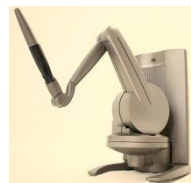
▲Freeform With Touch

デザインから型形状のモデリングまで可能な触感モデラー。 3Dプリンタ用のデータを最速のプロセスで作成可能。