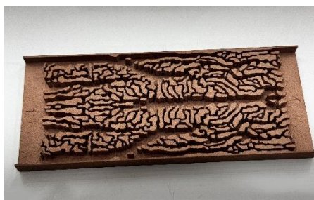
銅合金製 電子機器熱冷却プレート（模型）