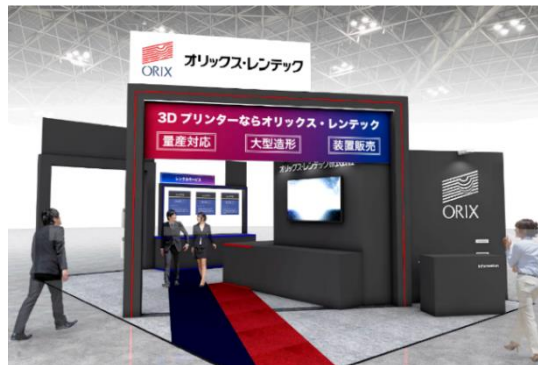
展示会ブースイメージ

オリックス・レンテック株式会社（本社：東京都品川区、社長：上谷内 祐二）は、2026 年 1 月 28 日（水）～1 月 30 日（金）の期間、東京ビッグサイトで開催される「TCT Japan 2026 -3D プリンティング& AM 技術の総合展-」に出展しますので、お知らせします。