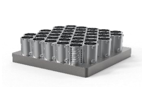
量産部品事例 EV 用水冷却装置（模型）