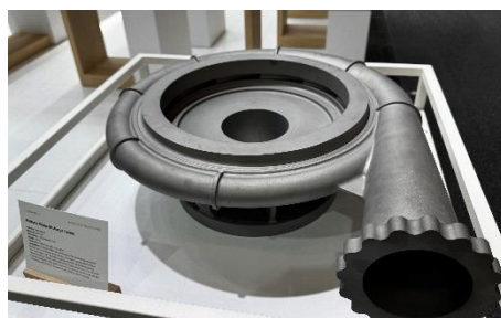
実部品事例 航空宇宙部品