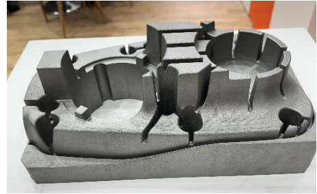
アルミ製品の量産用金型