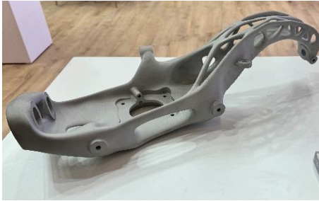
金属製自動車部品