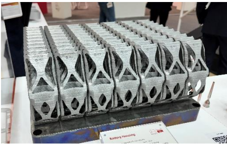
量産部品事例 EV 自動車用バッテリー保護ケース