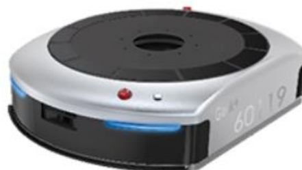
ピッキングロボット“EVE”（EVE800）

仕入れ商品の陳列やピッキングは、これまで作業員による手作業に拠っていたため身体的な負荷と作業効率の低さが課題でしたが、商品が並ぶ専用棚の下部に潜り込み、棚自体が作業員の待つワーキングステーションまで自動で移動する機能を持つピッキングロボット“EVE”の導入により、作業員の負担軽減が見込めます。さらに、省エネ設計により、30分の充電で10時間の稼働が可能で、手作業に比べて約3倍程度、作業効率の向上が図れます*。