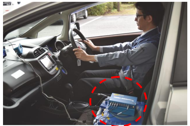
車両に計測器を搭載した様子 (左: 高解像度カメラ 右: 各種データを記録する装置)